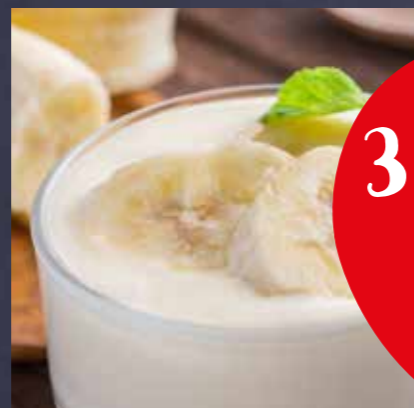
BANANEN YOGHURT FANTASIE