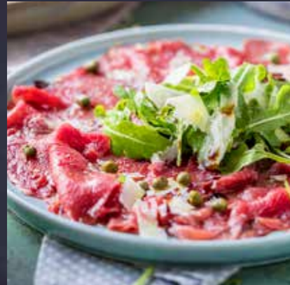
CARPACCIO MET RUCOLA, PIJNBLOEMPITTEN EN DRESSING

WORDT AANGELEVERD MET 1 AFBAKSTOKBROOD EN VERSE TAPENADE