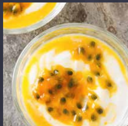
OPGESLAGEN YOGHURT MET PASSIE

WORDT AANGELEVERD MET EEN HEERLIJKE FRYSKE BEERENBURG BONBON VOOR BIJ DE KOFFIE