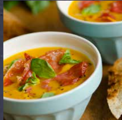
FRYSKE MOSTERD SOP