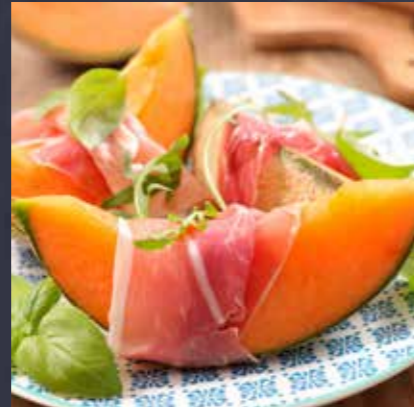
RAUWE HAM MET MELOEN MOUSSE